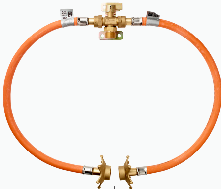
SAV-installation, manuel, mellemtryk 0,5 – 2 bar

Bruges bl.a. til skoler og institutioner, samt til installationer, hvor der er mere end 1 flaske i samtidig drift.